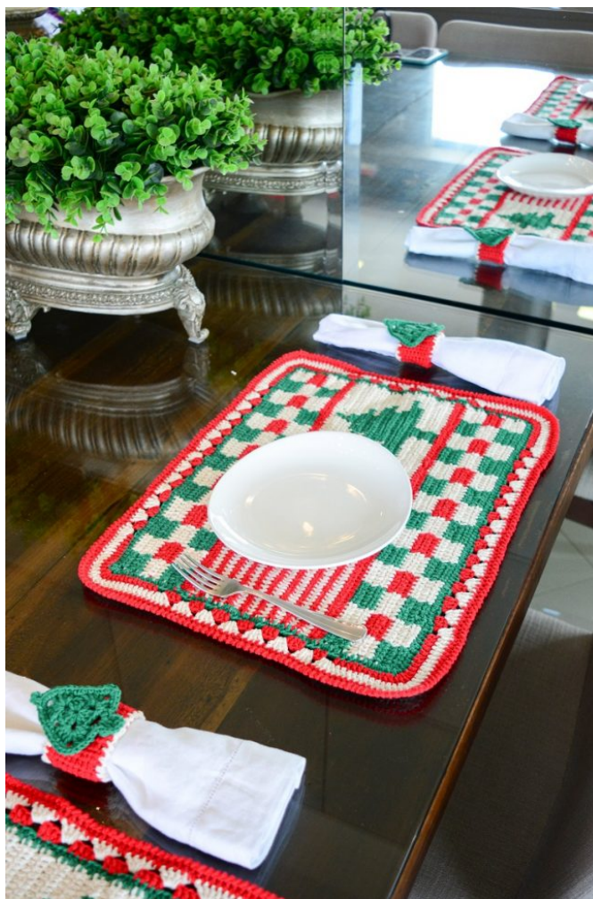
Jogo Americano Natalino