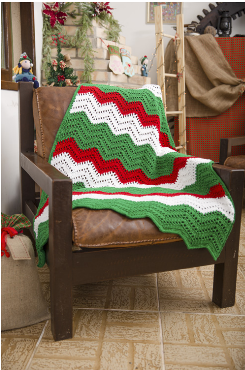
Manta Chevron de Natal